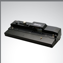
Station d'accueil pour bureau